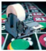
Lottery & Betting