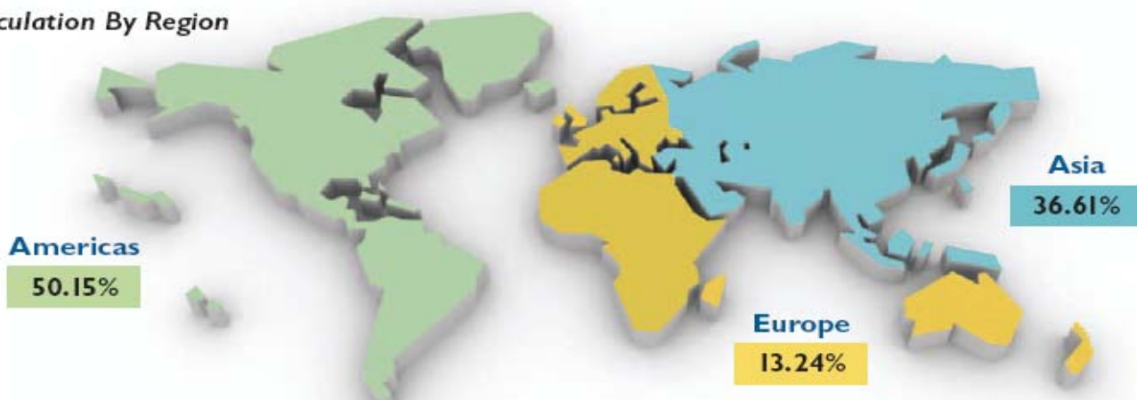
Circulation By Region